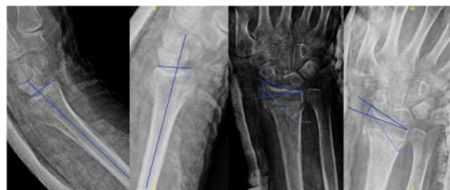
Figura 4. Ejemplo de desplazamiento entre la segunda y sexta semana.

Los otros doce casos (22,6%) en los que existe un importante desplazamiento que podrían haber supuesto un cambio de indicación del tratamiento conservador al quirúrgico, el desplazamiento fue entre la segunda y sexta semana (Fig. 4). De éstos, sólo un caso sobrepasaba los límites tolerables de deformidad.