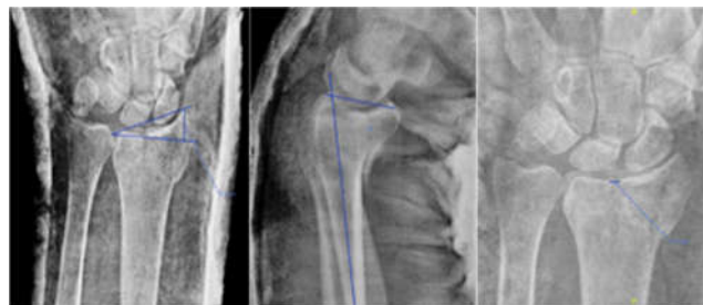
Figura 1. Parámetros radiológicos medidos pre y post reducción, a la segunda y a la sexta semana.

Además, también se han recogido los datos demográficos de sexo, edad y el tipo de inmovilización con el que fueron inmovilizados.